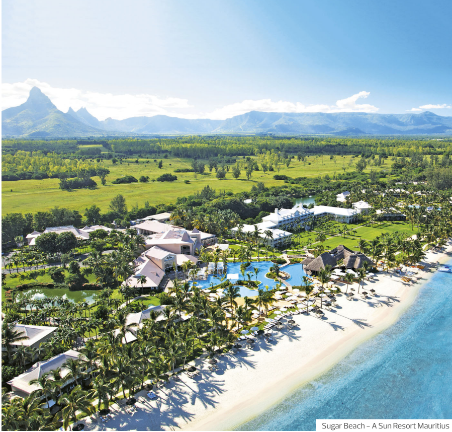
Sugar Beach – A Sun Resort Mauritius