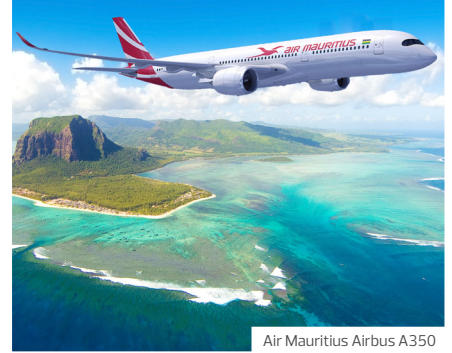
Air Mauritius Airbus A350