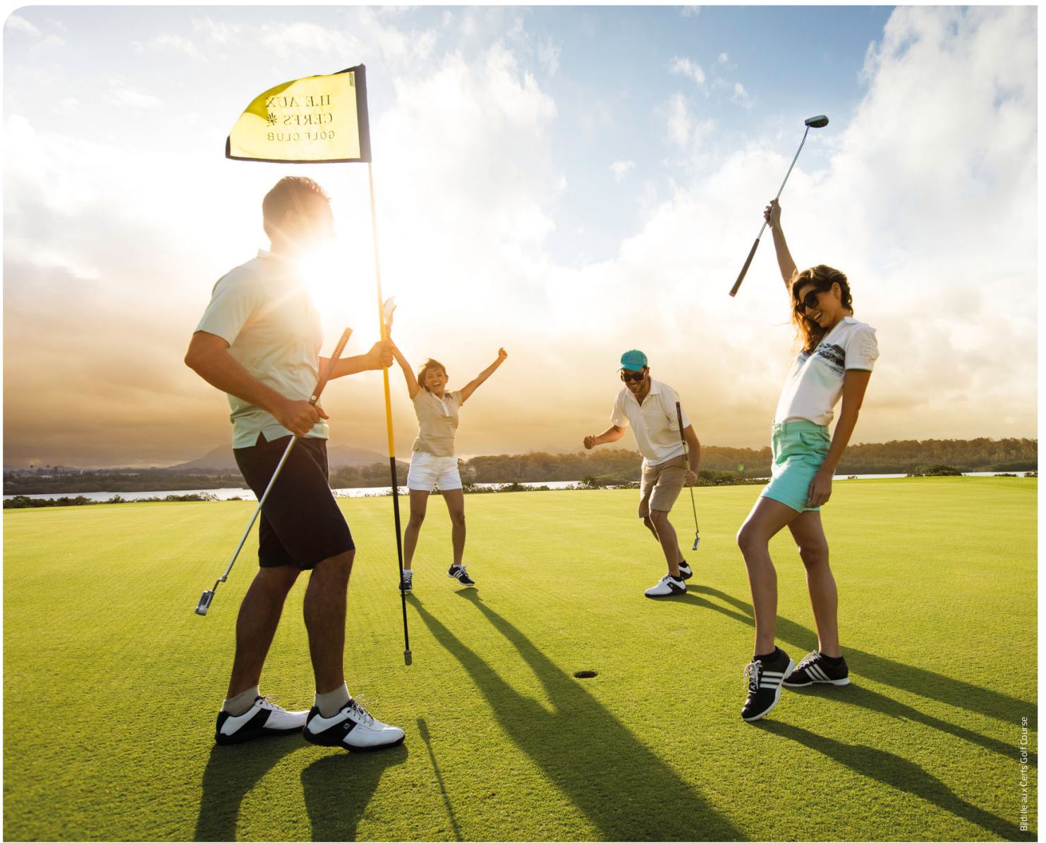
Bild: Ile aux Cerfs Golf Course